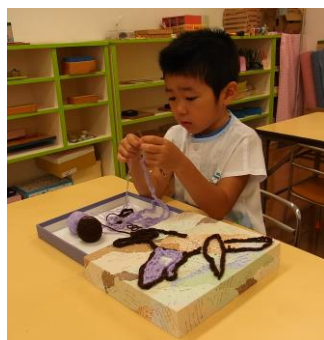
お仕事しています・・・