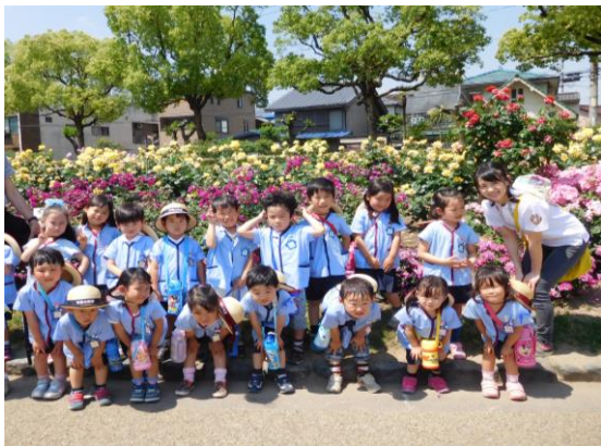
バラ公園での園外保育