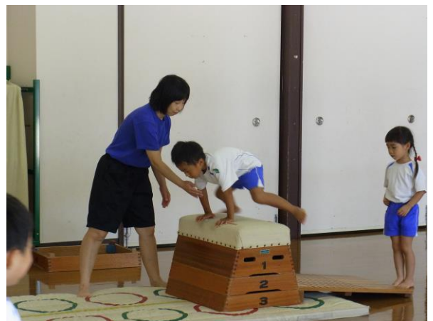
体操教室の先生の指導