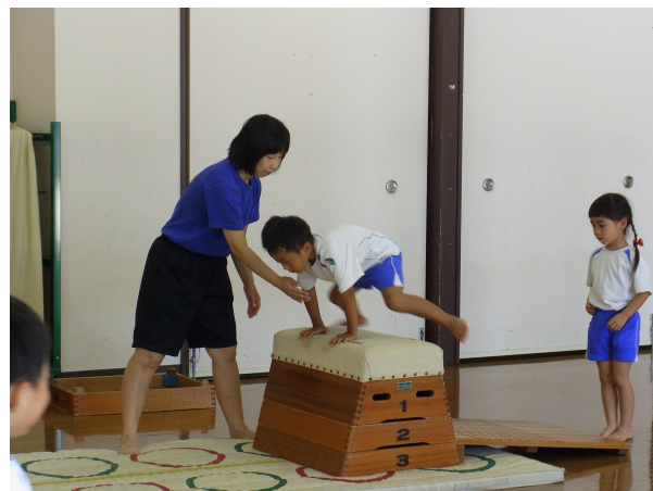
体操教室の先生の指導