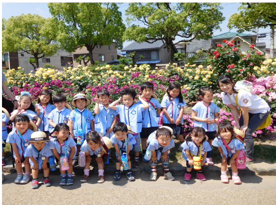
バラ公園での園外保育