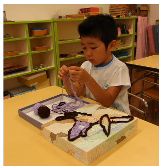
お仕事しています・・・